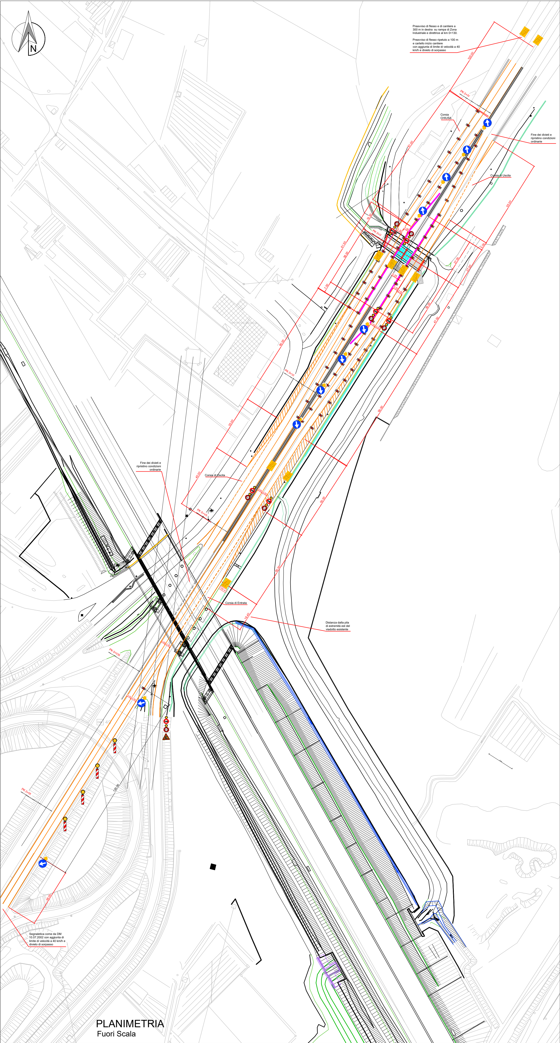
PLANIMETRIA Fuori Scala