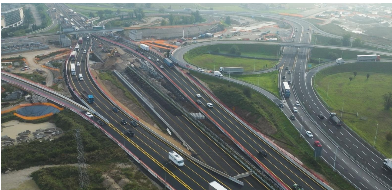
Verona Est: nuova configurazione delle carreggiate deviate

Le due carreggiate di entrambe le direzioni sono deviate all'altezza del km 290, per un tratto di 1,2 chilometri. La nuova configurazione, che garantisce le tre corsie per senso di marcia, proseguirà fino all'inizio del 2025, quando Iricav Due avrà completato i lavori necessari, e richiederà particolare attenzione alla guida, comportando la riduzione della velocità da parte dei viaggiatori per poter garantire la massima sicurezza e fluidità veicolare.