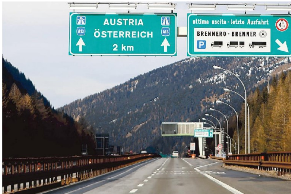
Autostrada del Brennero